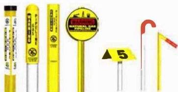
De izquierda a derecha: Marcador TriView™, Marcador Domo, Marcador Plano, Marcador Redondo, Marcador Aéreo, Marcadores de Tubos de Ventilación.

Aunque no siempre están presentes en ciertas áreas, estos marcadores se pueden encontrar en los cruces de ferrocarriles, las cercas y en las intersecciones de calles. Los marcadores muestran el producto que es transportado en la línea, el nombre del operador de la línea de tuberías y un número de teléfono donde puede contactar al operador en el caso de una emergencia.