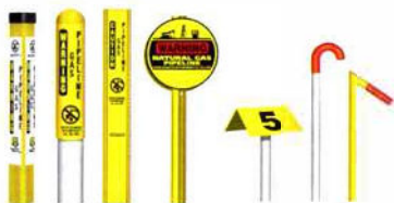
From left to right: TriView™ Marker, Dome Marker, Flat Marker, Round Marker, Aerial Marker, Casing Vent Markers.

Although not present in certain areas, these can be found at road crossings, fence lines, and street intersections. The markers display the product transported in the line, the name of the pipeline operator, and a telephone number where the operator can be reached in the event of an emergency.